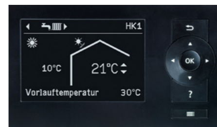
Контроллер теплового насоса Vitotronic 200