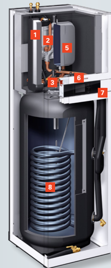
Vitocal 100-S (слева) Vitocal 111-S (справа) Внутренние блоки