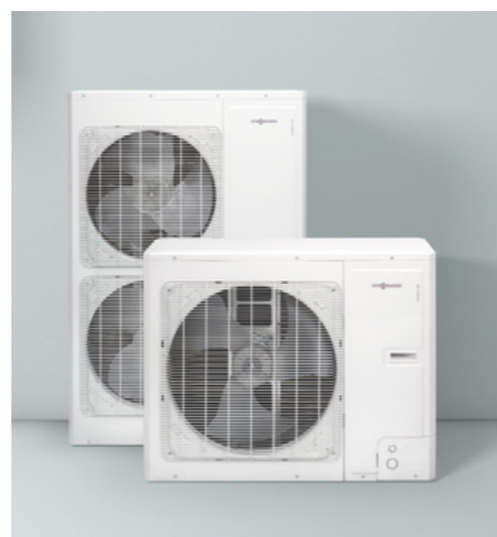
Наружные блоки насоса Vitocal 100-S

С дополнительным интернет-интерфейсом Vitosconnect тепловые насосы воздух/вода Vitocal 100-S / 111-S находятся в режиме онлайн. С помощью бесплатного приложения ViCare можно легко управлять со смартфона многими функциями, такими как регулирование температуры или «режим вечеринки».